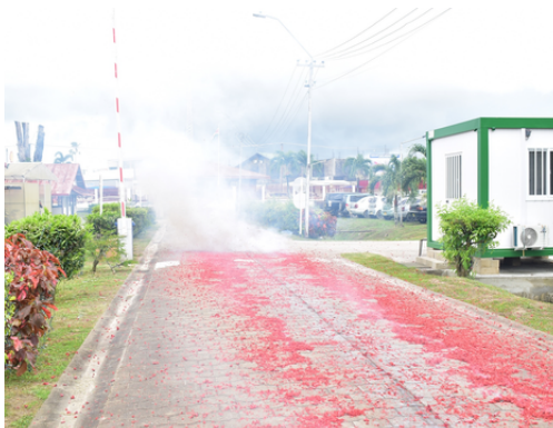
Afschieten van de pagara