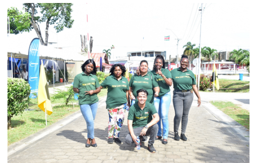
Het 'How Can I Help?' team