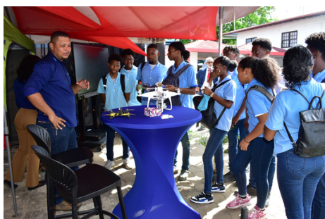
Uitleg over drones in de booth van AMPS