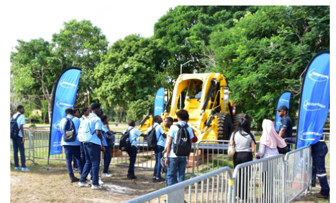
Zwaar materiaal van Kuldipsingh