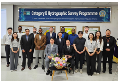
Groepsfoto van de participanten met de directeur, docent en begeleider

Anthony vertelt verder dat het programma uit 12 modules bestond plus een Comprehensive Final Field Project. Elke module bevatte een theoretische- en praktische training. De training was heel leerrijk en op een hoog niveau. Er moest veel aan zelfstudie worden gedaan.