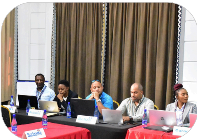
Een deel van de participanten uit de regio