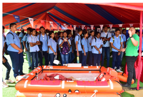
VOJ leerlingen in de MAS booth