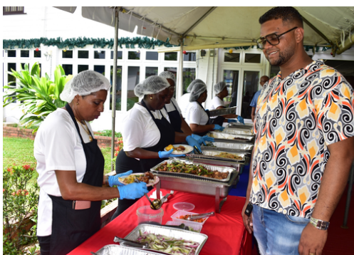
Het lopend buffet