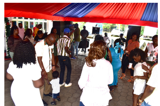
De benen losgooien