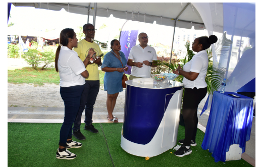
Bezoekers in de booth van DP World