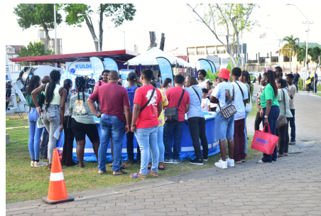
Bezoekers kijken naar de demonstratie