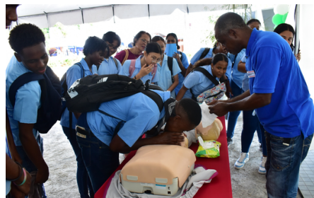
Een demonstratie van SSAS