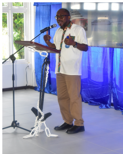
De directeur tijdens zijn speech