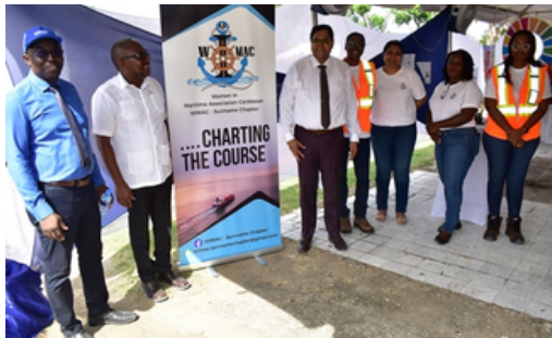
In de booth van WiMAC

De MAS bedankt alle bedrijven voor hun participatie en hun bijdrage aan het welslagen van dit evenement.