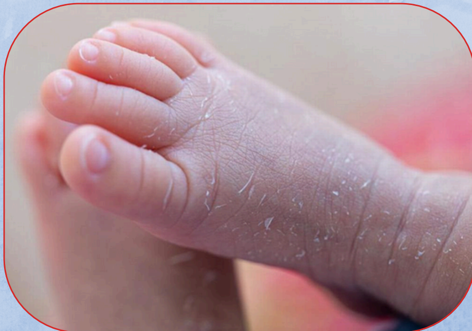
Droge huid op het voetje van een baby

Een droge huid bij kinderen voelt ruw aan en kan schilfertjes, huidscheurtjes en kleine puistjes veroorzaken. Bij baby's lijkt het alsof de droge huid loslaat, alsof je kindjes vervelt. Wat veroorzaakt die droge huid, wat is het verschil met eczeem, en wat kan je eraan doen?