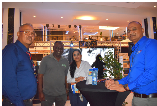
Met twee stakeholders van de MAS op de foto