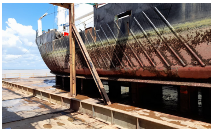
De Marwina zonder antifouling

Antifouling heeft verschillende voordelen. Het voorkomt bijvoorbeeld dat er aangroei ontstaat op de romp van het vaartuig, wat kan leiden tot verlies van vaarsnelheid en een hoger brandstofverbruik. Bovendien kan aangroei de romp beschadigen en zo de levensduur van het vaartuig verkorten. Door de juiste antifouling te kiezen en deze op de juiste manier aan te brengen, kun je ervoor zorgen dat het vaartuig in topconditie blijft.