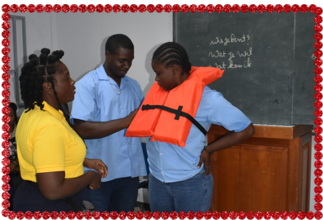
Een leerling demonstreert het dragen van een reddingsvest