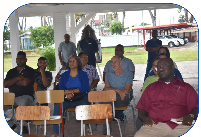
Informatiebijeenkomst met personen uit de visserijsector