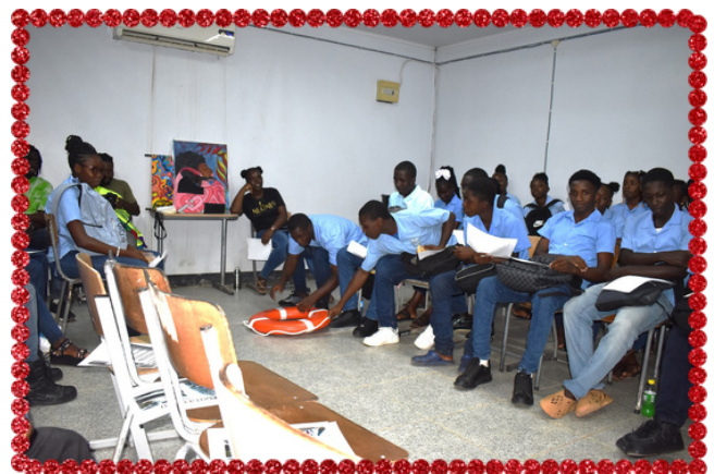
Demonstratie met een reddingsboei