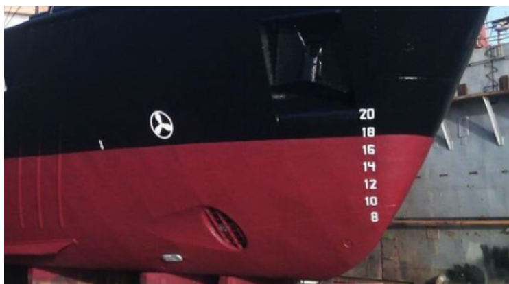
Antifouling aangebracht op de Marwina