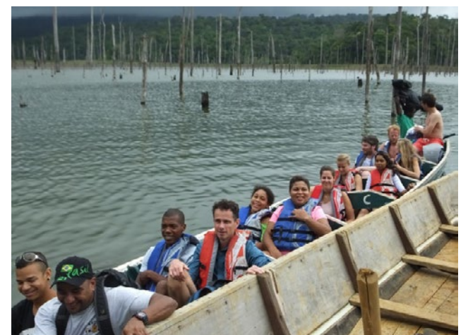
Een touroperator met toeristen op het Afobakameer. Het goede voorbeeld een reddingsvest te dragen is gegeven.

Om te voldoen aan de internationale eisen hebben wij goed opgeleide medewerkers en een multifunctionele hydrografisch schip geïmplementeerd door Lloyds Register.