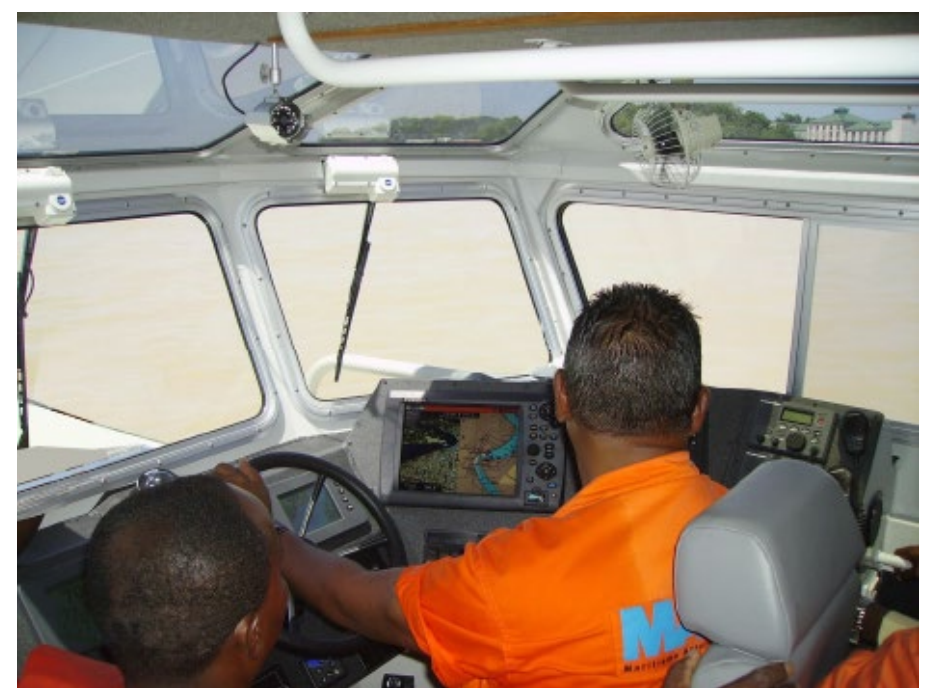
Een schipper van de MAS achter het roer van een van de loodsboten.