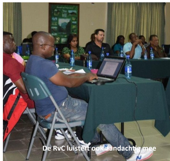
De RvC luistert ook aandachtig mee