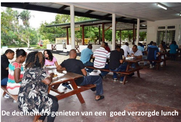
De deelnemers genieten van een goed verzorgde lunch