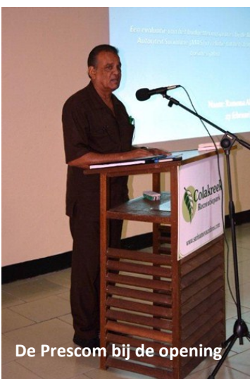
De Prescom bij de opening