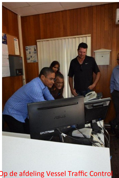
Op de afdeling Vessel Traffic Control