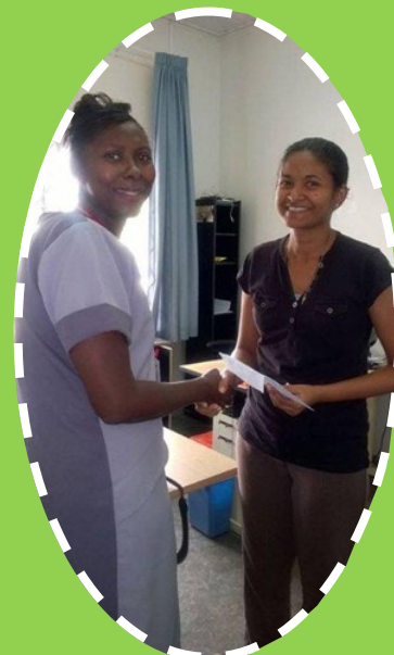
Overhandiging van een geldsbedrag aan het Kinderboekenfestival