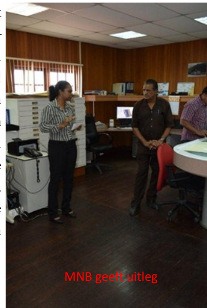
MNB geeft uitleg