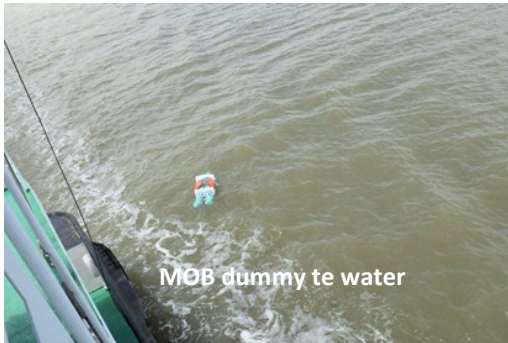
MOB dummy te water

Bij het werken op een schip kunnen zich omstandigheden voordoen waarbij men over boord kan geraken, met alle gevolgen van dien. Uiteraard is preventie (MOB voorkomen) het allerbelangrijkste, maar als het toch gebeurd moet de stuurman/schipper en zijn bemanning goed getraind en voorbereid zijn. Het is daarom belangrijk dat het schip vlug kan terugkeren naar de drenkeling en zodanig een goede positie kan aannemen ten opzichte van de drenkeling, zodat hij gemakkelijk gered kan worden. Als de drenkeling een reddingsvest aan heeft, zal hij/zij niet alleen drijven, maar ook veel gemakkelijker te lokaliseren zijn. Het dragen van een reddingsvest op een schip is