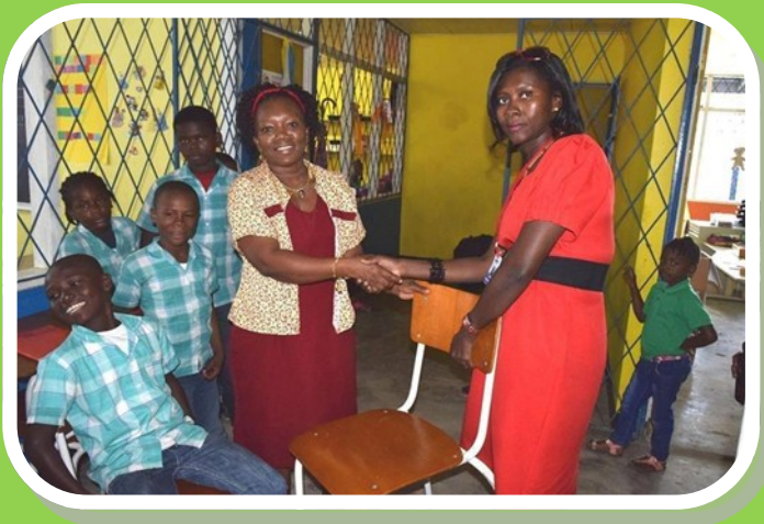
Schenking meubilair aan de Moriaschool

In onze Corporate Social Responsibility (CSR) gelden transparantie, duurzaamheid en verantwoordelijkheid als de basisvoorwaarden. De wensen van onze klanten zijn leidend in het bepalen van de strategie en richting van de MAS en worden daardoor altijd meegenomen in het bepalen van onze CSR.