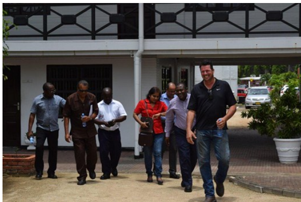
Op weg naar de steiger