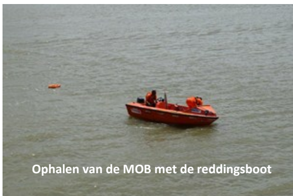
Ophalen van de MOB met de reddingsboot

ganger. Tegelijkertijd werd er een reddingsboei naar de MOB gegooid. Het stuur werd even omgegooid naar de bakboordzijde en daarna werd een draai gemaakt van 180 graden volgens de Williamson turn richting de MOB. De Williamson turn is een klassieke manoeuvre om zachtjes terug te komen op dezelfde plaats op tegengestelde koers. Het is vooral geschikt bij slechte zichtbaarheid of 's nachts. Deze manoeuvre wordt door de meeste zeemannen beschouwd als de zekerste methode om een drenkeling te redden, maar het is vast het traagste. Dikwijls duurt het meer dan 15 minuten voor een drenkeling in zicht is. Daarna wordt de MOB opgehaald door de boot.