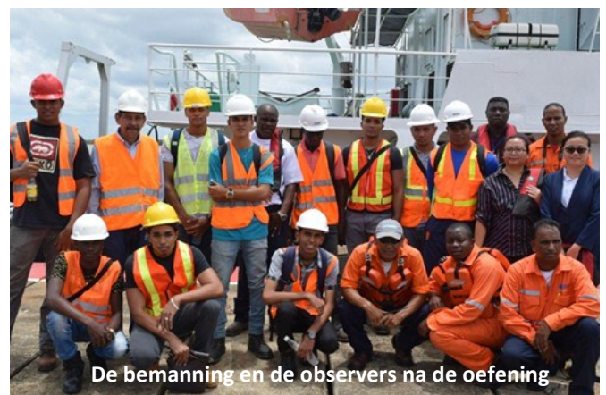
De bemanning en de observers na de oefening