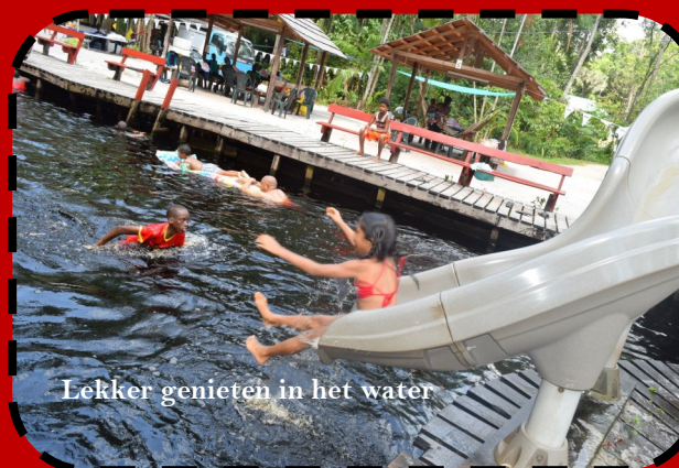
Lekker genieten in het water