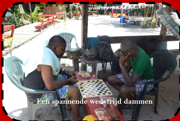
Een spannende wedstrijd dammen