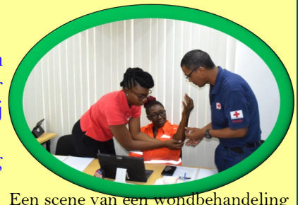
Een scene van een wondbehandeling