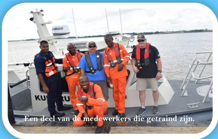
Een deel van de medewerkers die getraind zijn.

Nieuwe dingen moeten uitgetest worden, daarom is een deel van het varend personeel getraind hoe om te gaan met het vaartuig. Zij zullen op hun beurt aan kennis overdracht doen, het zogeheten train de trainer model hanteren. Na afloop van de vierdaagse cursus hebben de medewerkers op woensdag 18 september een certificaat ontvangen.