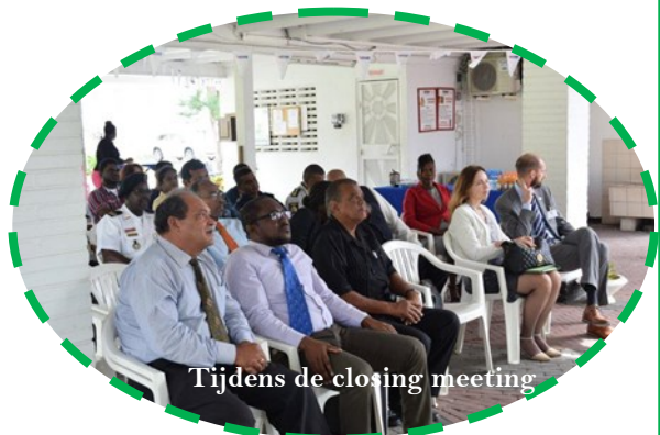
Tijdens de closing meeting

De MAS is de IMO focal point voor Suriname en in die hoedanigheid heeft de MAS de relevante actoren en stakeholders breedvoerig geïnformeerd over de audit die in de periode van 17 tot en met 26 maart 2018 is uitgevoerd. Naast de MAS stonden ook diverse stakeholders in de maritieme sector op de lijst om geaudit te worden. Het Ministerie van Openbare Werken, Transport en Communicatie heeft een belangrijke rol hierbij te vervullen, omdat het transportbeleid onder dit departement valt.