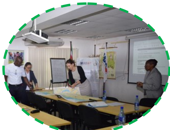
De auditors bekijken de nautische kaarten

Het vervolgtraject is dat Suriname het forum “Suriname National Maritime Association” zal oprichten als ook het “Suriname Maritiem Beleid en Strategie 2019-2069” zal ontwikkelen.