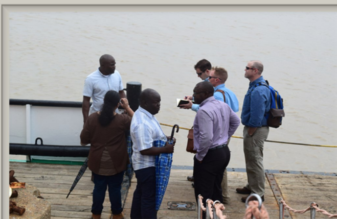
Ook op de Marwina hebben de heren een rondleiding gekregen