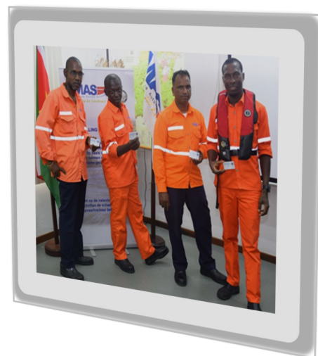
De heren met hun "Vaarbewijs I"