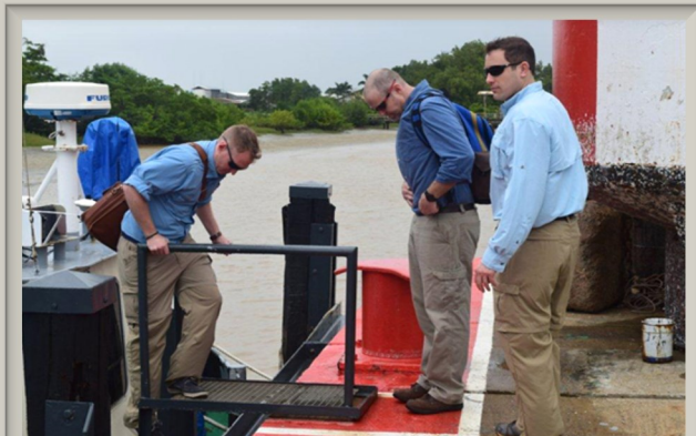
De delegatie gaat aan boord van de Pasisi