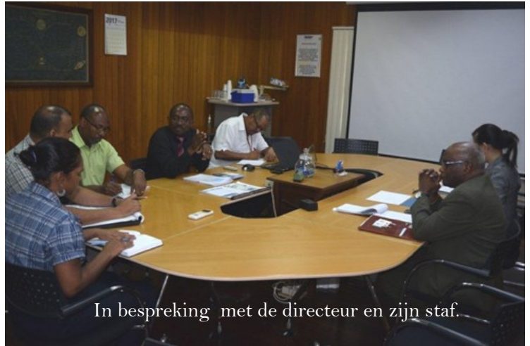
In bespreking met de directeur en zijn staf.