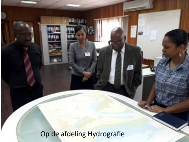
Op de afdeling Hydrografie