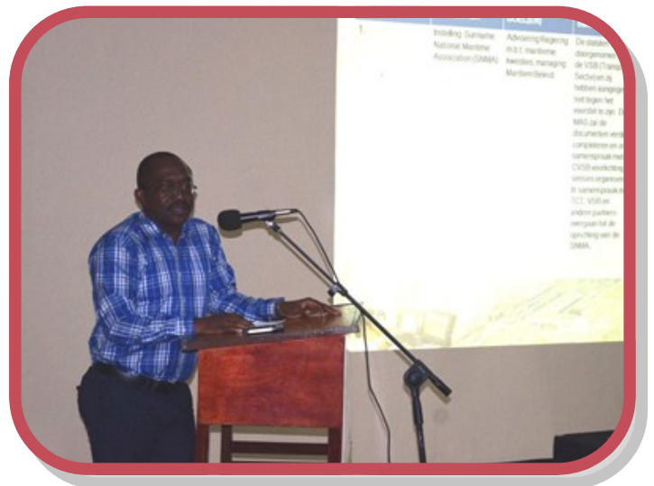
Ook de directeur heeft een presentatie gehouden