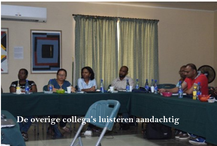
De overige collega's luisteren aandachtig

De dagelijkse bedrijfsactiviteiten uitgevoerd door ons allen, medewerkers van MAS, staan niet op zichzelf. Alles vloeit voort uit de vastgelegde doelstellingen in de wet MAS. In hoofdlijnen gaat het om het garanderen van de veiligheid van de scheepvaart en het toezicht houden op de naleving van de wettelijke regelingen het scheepvaartverkeer betreffende. Op basis van de doelstellingen wordt het Strategische Business Plan (SBP) opgesteld voor 5 jaren. Dit plan geeft de speerpunten aan voor het behalen van de doelen van het bedrijf. Het SBP vormt de basis voor het jaarplan van alle afdelingen. Het jaarplan wordt jaarlijks door alle afdelingen opgesteld en de afdeling Finance vat het samen in een totaal jaarplan voor het bedrijf. Vervolgens wordt gewerkt aan de realisatie van het jaarplan en na afloop van het jaar vindt de evaluatie plaats.