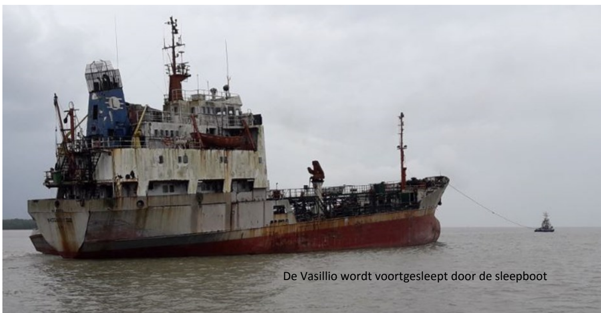
De Vasillio wordt voortgesleept door de sleepboot

De Vasillio VXIII is een motortanker die voor het laatst in 2013 de Surinaamse wateren is binnengevaren. Het schip werd nabij de steiger te Belwaarde aangemeerd en is toen als een wrak achtergelaten. Het havenbeveiligingscertificaat van de steiger werd vanwege de zeer slechte staat door de MAS ingetrokken. Vanwege het feit dat onze vaargeul dichtbij het schip loopt vormde het een potentieel risico voor onze operaties. De MAS heeft de eigenaren van het schip in het belang van de scheepvaart toen aangemaand om het schip van haar locatie te verwijderen. Dit proces heeft wat tijd in beslag genomen maar op 18 januari 2017 was het eindelijk zover. De Vasillio VXIII werd door de huidige eigenaar van Guyanese afkomst, uit onze wateren gesleept naar Guyana.